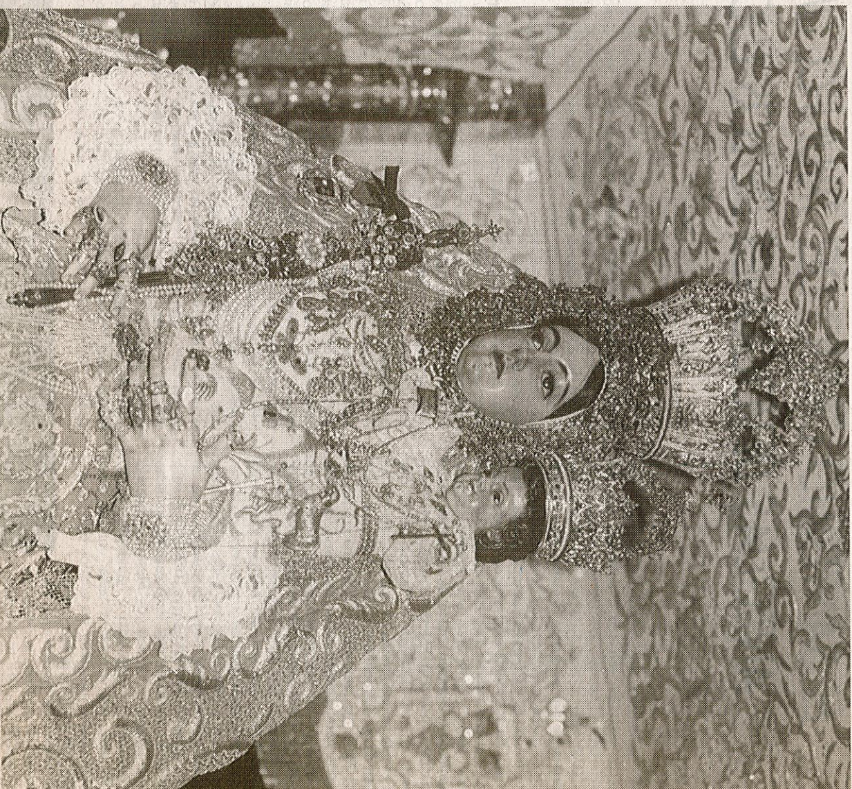
Imagen de Nuestra Señora de Araceli, patrona de Lucena y del campo andaluz.

Sin embargo, hay otros textos del Antiguo Testamento, que la Iglesia se los aplica a la Virgen, no en su sentido genuino sino acomodaticio, teniendo conciencia que la Escritura no habla de la predestinación de Ella, sino del Verbo: "El Señor me creó al principio de sus tareas, antes de sus obras más antiguas. Fui formada en un pasado lejano, antes de los orígenes de la Tierra. Cuando aún no había océanos fui engendrada..." (Prov. 8, 22-24). En el mismo sentido, se pudiera aplicar la cita del Eclesiástico 24, 5.7.14. (Artículo publicado en la revista Araceli , de la Real Archicofradía).