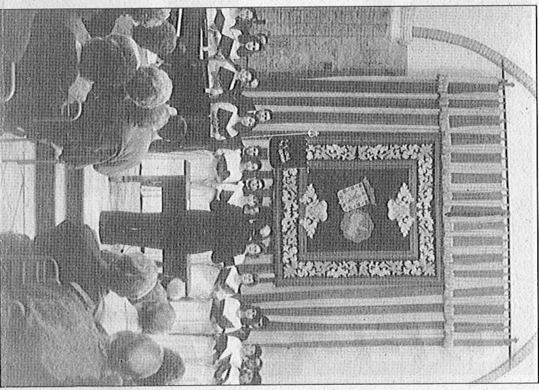
La Coral Lucentina, en una actuación en Córdoba.

La Coral Lucentina consiguió en Torreveja (Alicante), el premio nacional de interpretación polifónica del folklore regional en 1982 y el de mejor interpretación estilo cubano en 1983. Y otro éxito fue su actuación en el Festival Coral del Atlántico, celebrado en Isla Cristina (Huelva). La Coral se apuntó otro gran triunfo en la su actuación en la Semana Lírica Cordobesa, al igual que en el Teatro Imperial de Sevilla, interviniendo, con "gran brillantez" como hacía constar la crítica de la prensa, en las representaciones de la zarzuela Los Gavilanes, junto con la Gran Compañía Lírica de Miguel de Alonso. Digno de mención es asimismo el dato de que la Coral Lucentina cuenta en su repertorio con más de un centenar de obras, clásicas, populares, religiosas y cantos navideños. Basta insistir finalmente en que, por todo ello, la Coral Lucentina es una institución de la que realmente tenemos motivos para sentirnos orgullosos todos los lucentinos.